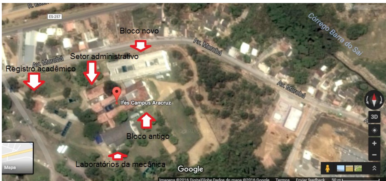
Vista superior feita por satélite do Campus Aracruz

O Ifes campus Aracruz localiza-se à Avenida Morobá, em um terreno próprio com cerca de 45.887,27 mil metros quadrados, adjacente à sede da Prefeitura Municipal de Aracruz, no Bairro Morobá, conforme ilustra a figura abaixo.